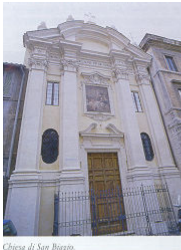
Chiesa di San Biagio.

Un apposito link verrà inserito nel sito comunitaarmena.it per rendere più agevole e fruibile la consultazione del percorso.