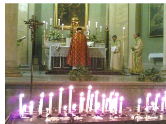
Chiesa di S. Biagio a Roma