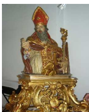
S. Biagio a Castiglione a Casauria