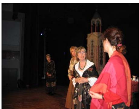
Alcuni momenti delle prove dello spettacolo: durante la prima le riprese televisive non consentivano l'uso del flash fotografico