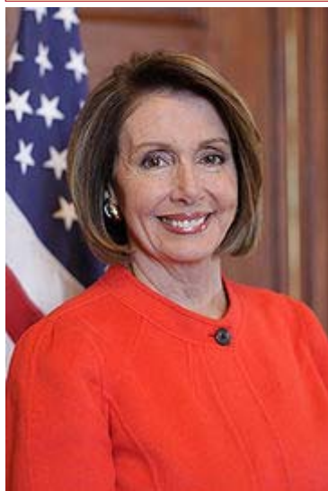
Il presidente della Camera, Pelosi