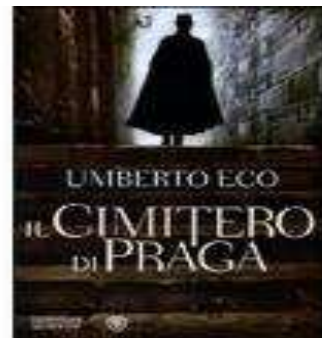
UMBERTO ECO, Il cimitero di Praga , Bompiani 2010

Purché sia sempre là a rinfocolare il nostro odio. L'Odio riscalda il cuore.