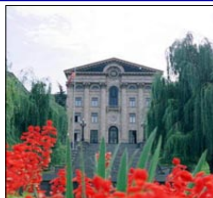
La sede dell'Assemblea Nazionale armena

Una delle priorità della futura Armenia: il miglioramento delle condizioni di vita delle zone rurali