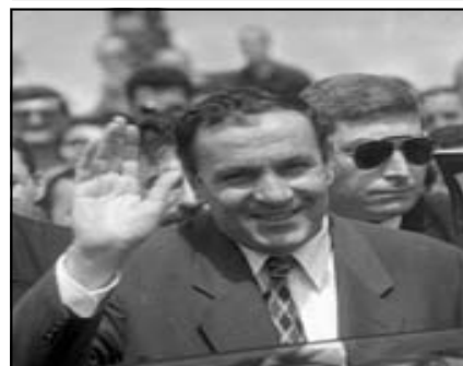
Il primo Presidente Levon Ter-Petrosian

Il dibattito all'interno della società armena si sviluppa sul fronte della libertà di pensiero ed associazione (non erano mancati negli