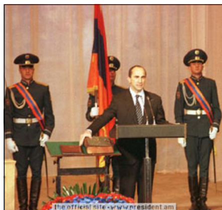
L'attuale Presidente Robert Kocharian