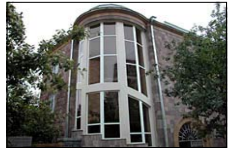
Il museo Sarian a Yerevan

In Italia chi spiegò meglio di chiunque altro la poesia dei vari Ararat di Sarian fu