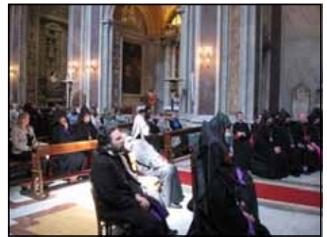
Pane e sale all'ingresso e uno scorcio della chiesa