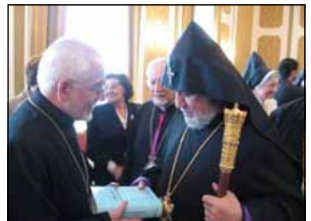
Saluti e foto ricordo nel salone del Collegio