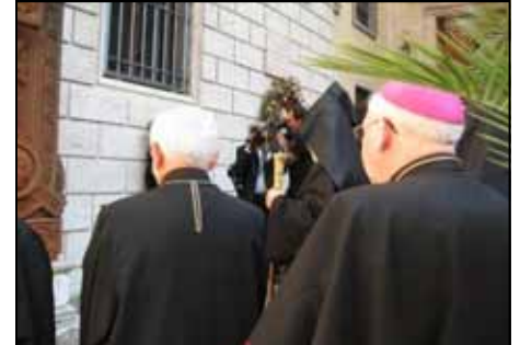
L'arrivo di Karekin e la sosta davanti al katchkar