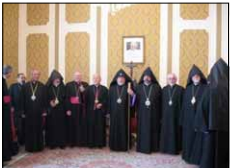
Un momento della cerimonia in chiesa e foto di gruppo