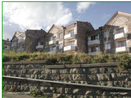
Nuove eleganti palazzine a Spitak. Sotto un'altra immagine della cittadina e in basso uno scorcio di Stepanavan.

Spitak (anticamente Amamlu) è rinata; grazie all'impegno degli armeni ed ai tanti aiuti della cooperazione inter-