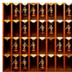
I BARONI DI ALEPPO FLAVIA AMABILE MARCO TOSATTI

«Può un albergo raccontare la storia della Siria attraverso le vicende della famiglia che lo ha gestito per un secolo?»