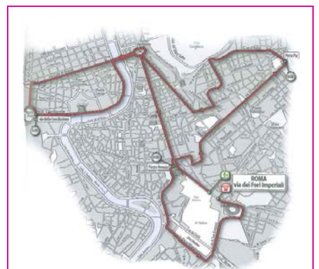
La mappa dell'ultima tappa al Giro. Il Collegio armeno si trova proprio nell'angolo alto a destra,