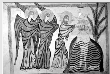
Battesimo, Vangelo del 1038, Erevan, Matenadaran, N. 6201, f. 5. Grande Armenia, Taron.

La miniatura armena è sempre facilmente riconoscibile, e la sua peculiarità consiste nella sua posizione «all'incrocio» tra Oriente e Occidente. Infatti, la cultura armena comprendeva in sé questi due principi, distinguendosi tuttavia dall'Occidente per un più sviluppato simbolismo e capacità di astrazione, e dall'Oriente per una maggior forza figurativa ed espressiva.