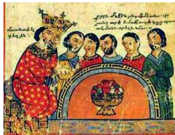
Ultima cena a Babilonia, Venezia, Biblioteca di San Lazzaro

“Una voce armena” Canti liturgici e popolari