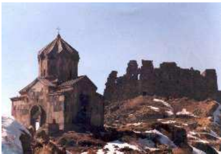
La fortezza e castello di Amberd del X-XII sec

L'incontro vuole essere occasione per ricordare il terribile genocidio degli Armeni nel 1915.