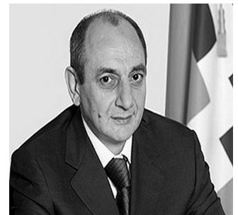
Il presidente della repubblica dell'Artsakh, Bako Sahakyan.

http://www.panorama.am/en/politics/2011/09/